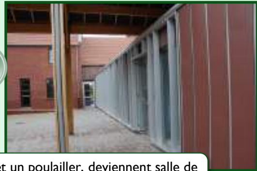
Quand un porche, un laboratoire et un poulailler, deviennent salle de motricité et gymnastique !