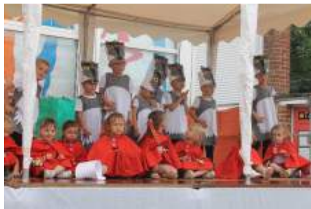
Classe de TPS/PS/MS/GS