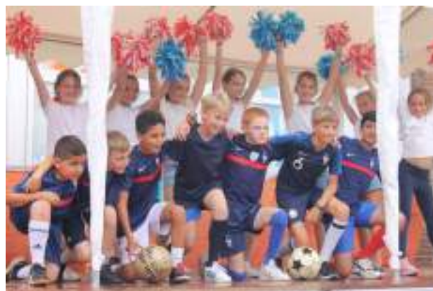
Classe de CMI/CM2