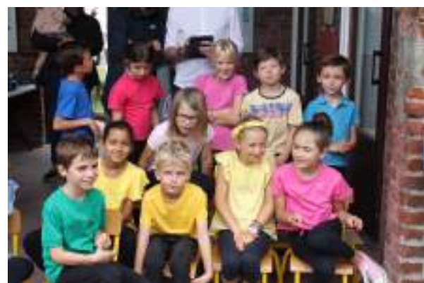
Classe de CP/CE1/CE2