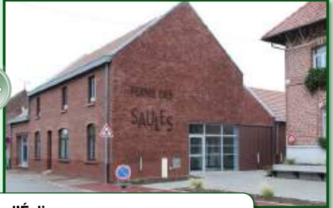
Métamorphose de la façade rue de l'Église, Aujourd'hui l'accès se fait près des Merlettes avec un parvis piétonnier établissant une cohésion entre les deux espaces.