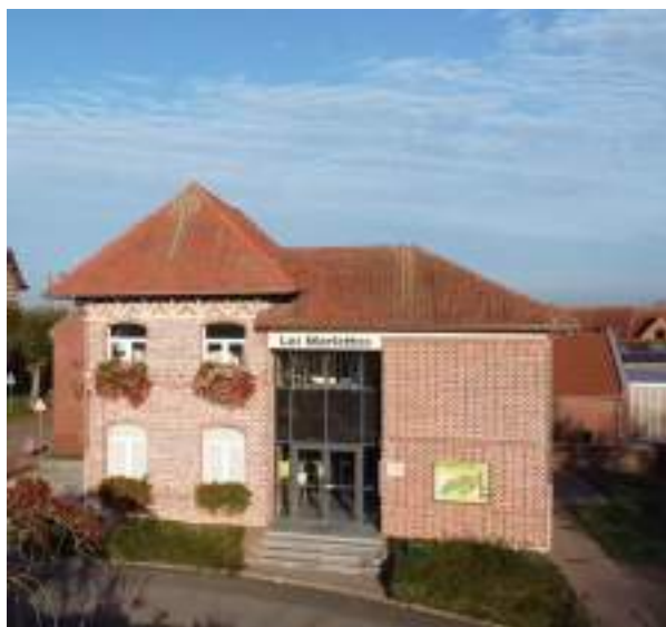
Une médiathèque spacieuse et conviviale

L'idée de développer un véritable espace Jeunesse a rapidement émergé. La création de cet espace s'accompagne également d'un réaménagement complet des collections.