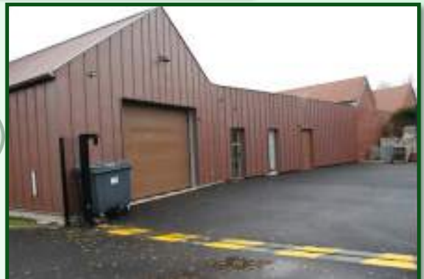
Quand un jardin est remplacé par une cour technique !